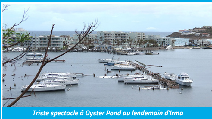
Triste spectacle à Oyster Pond au lendemain d'Irma

Escale très appréciée des plaisanciers, Saint-Martin a lourdement souffert du cyclone Irma. Plus de 860 bateaux ont été impactés, dont environ 360 réduits à l'état d'épaves. Il reste aujourd'hui 148 de ces bateaux hors d'usage (BHU) à traiter.