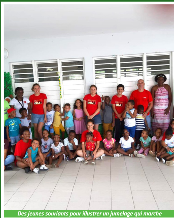
Des jeunes souriants pour illustrer un jumelage qui marche

Âgés de 15 à 17 ans, douze garçons et filles originaires de Bry-sur-Marne ont eu la bonne idée de consacrer une partie de leurs vacances à la jeunesse saint-martinoise. Tous membres du conseil municipal des jeunes de Bry, certains d'entre eux connaissaient déjà Saint-Martin, puisqu'ils étaient venus donner un coup de main post-Irma en février 2018. Le but cette fois a consisté à s'occuper des plus jeunes, en animant l'accueil des centres de loisirs gérés par la CTOS dans plusieurs écoles. Ils avaient avant cela bénéficié d'une formation, où ils ont appris par exemple la bonne manière de mettre un jeu collectif en place ou les meilleures activités pour que les enfants s'amuse en toute sécurité. L'expression artistique a figuré au programme et l'on pourra longtemps admirer le «mur de solidarité» sur lequel ils ont peint une