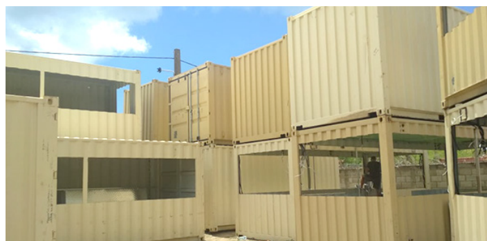
Les conteneurs en cours d'aménagement

Sur le front de mer, 14 restaurants, 5 bars et 6 boutiques seront prêts à accueillir leurs clients avant le début de la saison touristique 2019-2020.