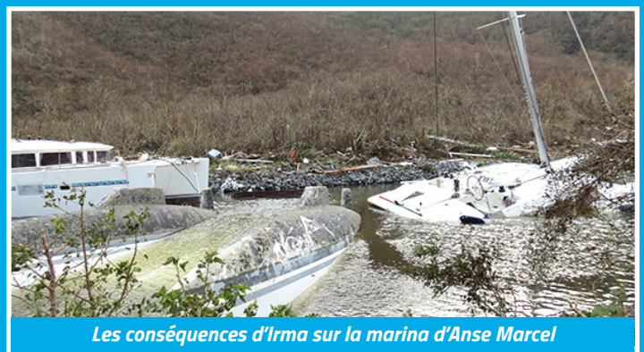
Les conséquences d'Irma sur la marina d'Anse Marcel

Débarrasser le lagon de Simpson Bay, Sandy Ground, Cul-de-Sac, Marigot et Oyster Pond des épaves qui les encombrant et représentent une menace pour la sécurité et l'environnement, en accomplissant ce travail dans les règles. Voici la mission qui incombe à la Collectivité, qui bénéficie depuis 2007 de la compétence sur le domaine maritime et a récemment attribué le marché à une entreprise spécialisée dans ce domaine. Ce marché, d'un montant de 2,35 M€, se décompose en trois forfaits : l'enlèvement des bateaux hors d'usage, leur dépollution et enfin l'évacuation des déchets issus de cette dépollution. Le prestataire utilisera une barge qu'il localisera sur les différents sites pour sortir chaque épave de l'eau et la dépolluer. Les déchets seront ensuite acheminés par la mer jusqu'au port de Galisbay, d'où ils partiront vers l'écosite ou vers d'autres territoires. L'entreprise estime à moins d'un an le temps nécessaire pour boucler cette tâche. Elle devra auparavant être enregistrée auprès de la Direction de l'environnement, de l'aménagement et du logement (DEAL), une procédure nécessaire avant toute manipulation, les BHU étant considérés comme déchets dangereux par le code de l'environnement.