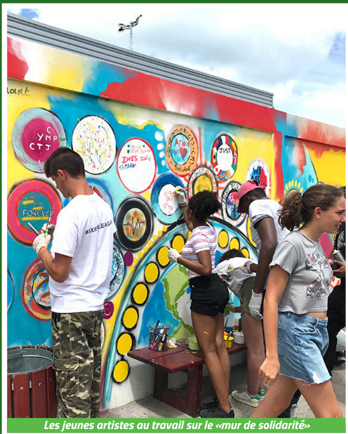
Les jeunes artistes au travail sur le «mur de solidarité»