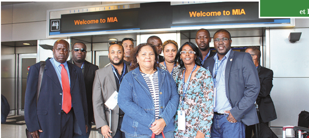
La délégation saint-martinoise à son arrivée à l'aéroport de Miami

pline, et des présidents des clubs de football de la partie française, dans le but de travailler sur le développement du football saint-martinois.