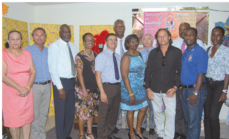
Inauguration de la semaine du Handicap à la Collectivité, le lundi 17 mars

Pour joindre la direction de l'Autonomie, les administrés peuvent contacter le Pôle Solidarité et Familles 05 90 29 13 10 et demander la direction de l'Autonomie des personnes.