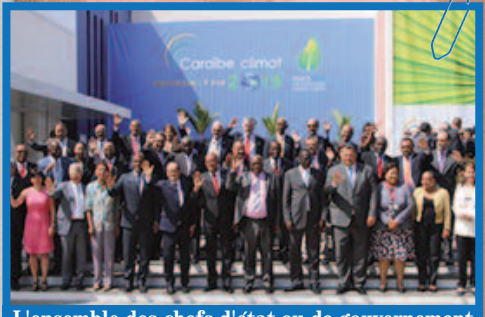
L'ensemble des chefs d'état ou de gouvernement de la Caraïbe pose avec le président français et ses ministres