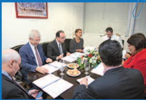
Un entretien de travail de 45 minutes dans le bureau de la présidente