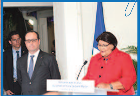
Le discours de la Présidente