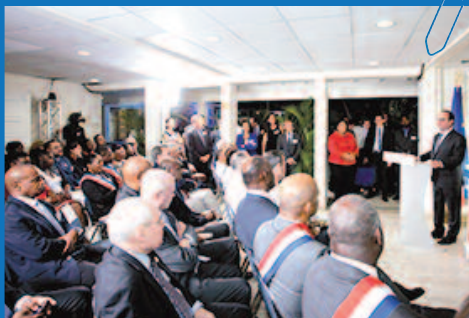
Les élus attentifs au discours du président