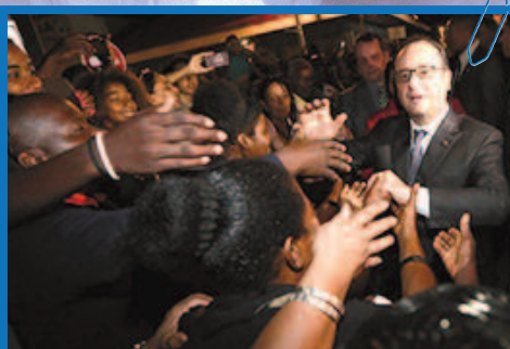
Le président effectue un deuxième bain de foule