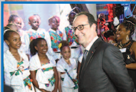
Le président félicite les enfants de la Chorale périscolaire