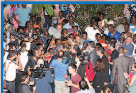
Un accueil appréciable pour le président