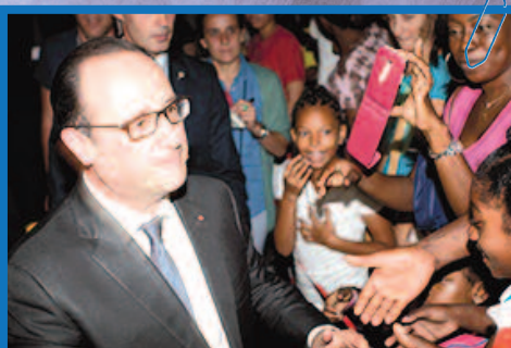
Un accueil très chaleureux pour le président