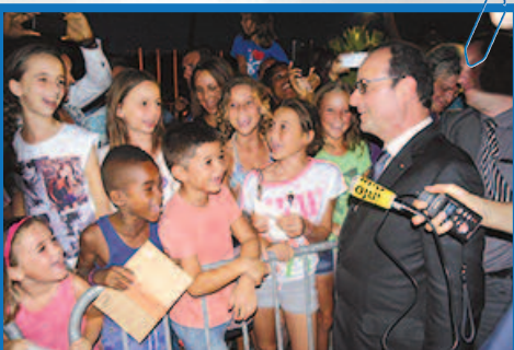
Grand Case - Le président échange avec des enfants venus l'attendre à l'aéroport