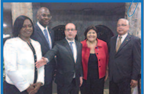
Lors du dîner présidentiel au restaurant Les Tocqués à Marigot