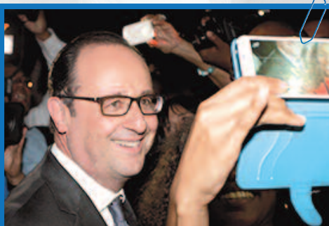
François Hollande se prête volontiers au jeu des selfies