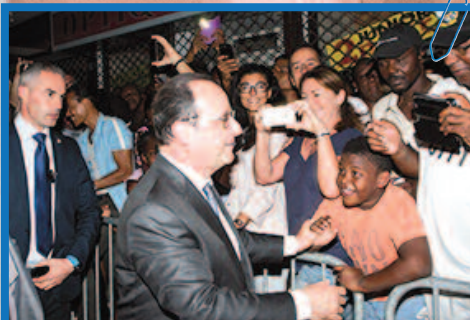
Arrivée à Marigot, le président salue la population