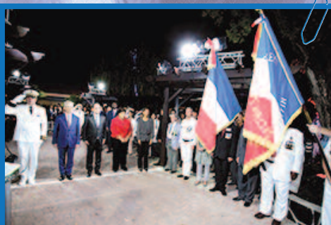
La commémoration de l'armistice de la guerre 39-45