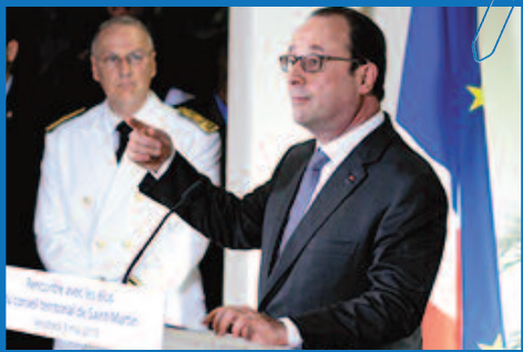
Le président fait de nombreuses annonces en faveur du territoire