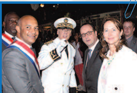
Arrivée en collectivité