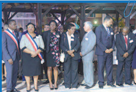
Les élus du conseil territorial attendent le président de la République