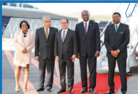
Le président de la République est accueilli par la délégation de Sint Maarten