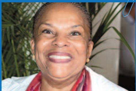
Christiane Taubira heureuse de retrouver la Caraïbe