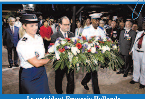
Le président François Hollande dépose une gerbe de fleurs devant le monument aux Morts de Saint-Martin