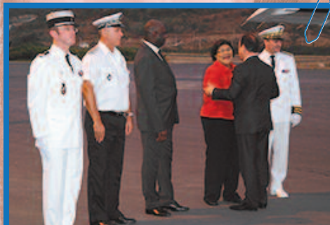
Au retour de St Barth, le président est accueilli à Grand Case par la délégation de la Collectivité