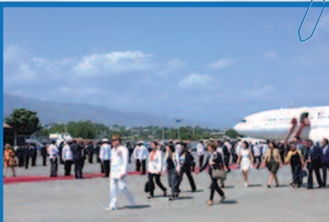
Arrivée de la délégation française en Haïti