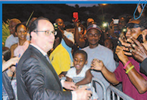
Grand Case - premier bain de foule pour le président français