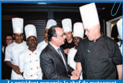
Le président remercie le chef du restaurant Les Toqués et les élèves de la section hôtelière du lycée