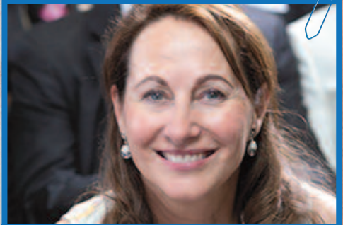
Ségolène Royal, radiuseuse à l'hôtel de la Collectivité