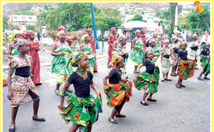
Les petites danseuses de la troupe Grain d'Or