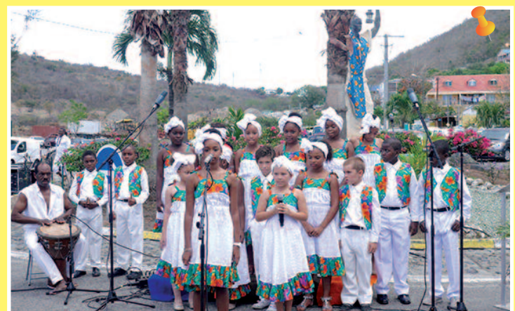
Une très belle prestation de la chorale du périscolaire