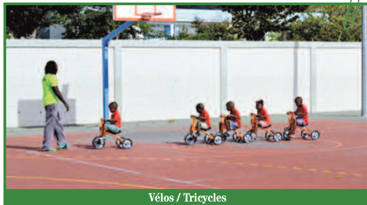
Vélos / Tricycles

L'USEP et la CTOS (Caisse territoriale des œuvres scolaires) se sont donné rendez-vous juste avant les grandes vacances pour la 2ème édition de L'USEP CTOS CUP. Le stade Jean-Louis VANTERPOOL a accueilli pendant 3 jours les enfants du périscolaire et les jeunes des différents cycles scolaires de l'USEP pour s'adonner à plusieurs Activités Physiques et Sportives (APS).