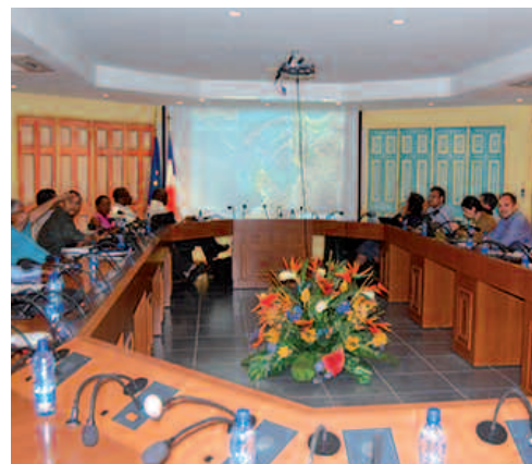
Les élus et le groupement de l'AMO en réunion de travail, le vendredi 13 juin 2014

Expertise financière et fiscale : Stratorial Finances