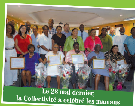
Le 23 mai dernier, la Collectivité a célébré les mamans

Lors de cette belle cérémonie de récompense, les parcours méritants de chaque papa ont été mis en lumière ; tous sont repartis avec un certificat de reconnaissance et un présent de la part de la Présidente et de ses conseillers territoriaux.