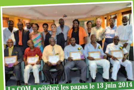
La COM a célébré les papas le 13 juin 2014

Comme elle l'a fait le 23 mai 2014 avec les mamans, la Collectivité de Saint-Martin a souhaité célébrer les papas, le 13 juin dernier. Organisée en collaboration avec les six conseils de quartier de Saint-Martin, cette fête des pères collective a mis à l'honneur six papas émérites, dont le parcours exemplaire a attiré l'attention des responsables des conseils de quartier qui les ont choisis.