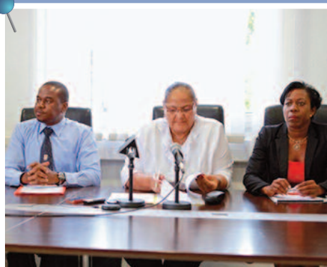
Février 2014 : la Présidente annonce le démarrage de l'aménagement de la baie de Marigot

Le projet d'aménagement de la baie de Marigot est entré dans sa phase opérationnelle mi 2014, la collectivité ayant lancé un appel d'offre pour l'assistance à maîtrise d'ouvrage (AMO) visant à engager le processus. Alors que les élus du conseil territorial ont défini au mois de juin les grands axes d'aménagement de la baie, la phase des concertations publiques a débuté à la mi-juillet avec la pose de la première pierre programmée en 2016. Le projet retenu par la Collectivité prévoit la création d'un bassin d'environ 32 hectares destiné à accueillir le trafic inter-îles, deux paquebots de moyenne croisière, et 94 places dédiées à la mini croisière. Ce bassin s'accompagne de la création de 21,5 hectares de surface remblayée. Un grand projet structurant qui propulsera Saint-Martin dans une ère touristique nouvelle.