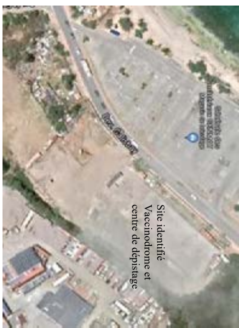
Annexe : plan implantation et plan du site