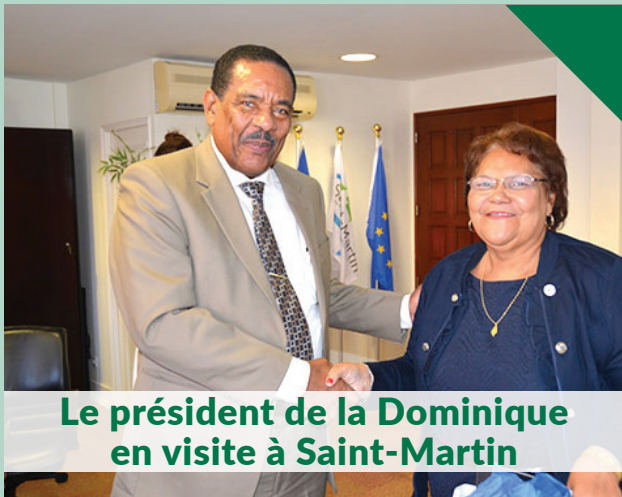
Le président de la Dominique en visite à Saint-Martin