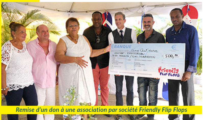
Remise d'un don à une association par société Friendly Flip Flops