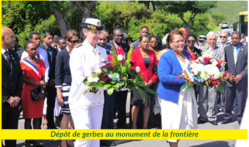
Dépôt de gerbes au monument de la frontière