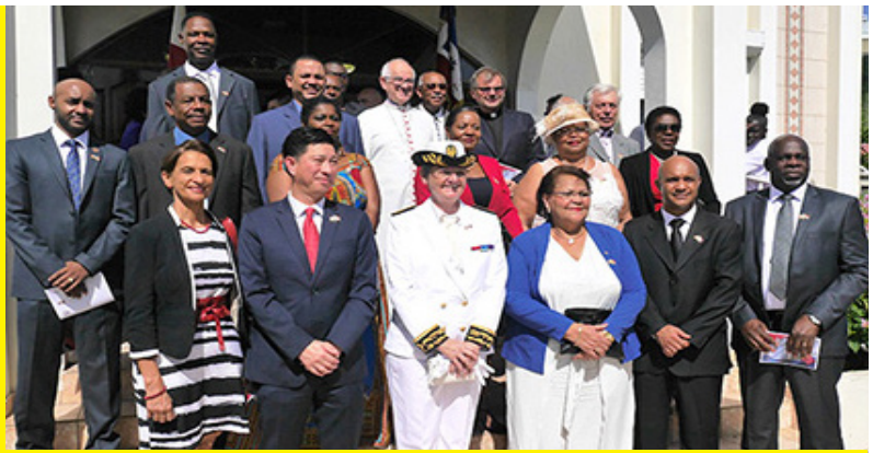
Sortie de la messe oecuménique - Eglise du Tabernacle

La collectivité de Saint-Martin tient à remercier l'ensemble des personnes et les nombreux bénévoles qui ont donné de leur temps pour les enfants.